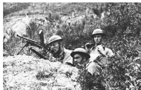
參與香港保衛戰的加軍。

在同仇敵愾的氛圍下，加拿大民眾對華人維權活動也開始作出讓步。各級政府紛紛更改法律，恢復華人的合理合法權益。1947年，《排華法》被廢除，當時距離「香港保衛戰」只有六年。1949年，華人終於可以在省選與聯邦選舉中行使公民權利，投下神聖一票。在不到十年的時間之內，加國華人由沒有合法權利、身分曖昧的二等公民搖身一變成爲加拿大公民。