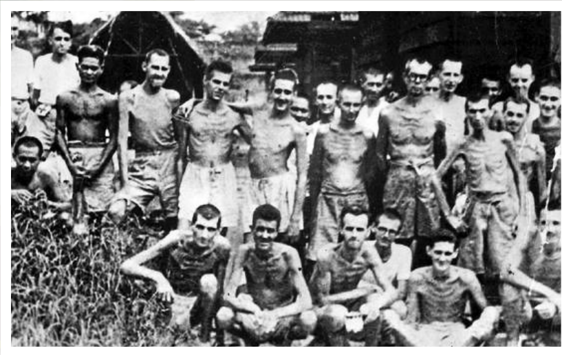
▲被日軍俘虜的加拿大軍人。

1938年：議員動議，促請聯邦政府廢止與日本簽訂的日本移民條約。同時把省議會中，提出反對日本人與華人入境卑詩省的意見，載入記錄。動議通過。