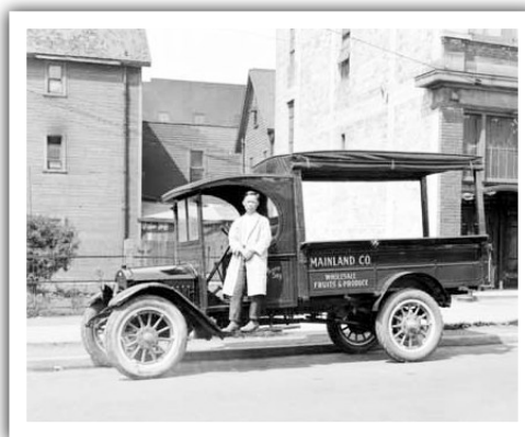
▲1926年的華人果菜批發商。(溫哥華圖書館歷史圖片)

1934年 | 卑詩海岸蔬菜銷售局 (BC Coast Vegetable Marketing Board) 成立，目的是限制華人經營的果菜農場進一步擴大市場佔有率，令矛盾進一步激化。警察也插手，鎮守各運輸