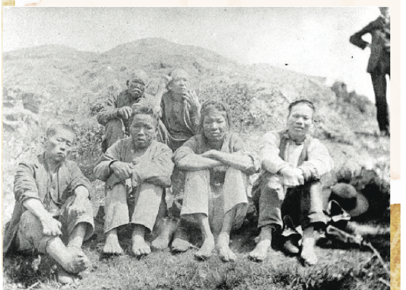
▲ 18世紀90年代被隔離在達西島的華裔癩瘋病人。

1907年1月溫哥華市議會設立於華埠旁邊的喜士定街（Hastings St.）夾緬街（Main St.），也就是現今的卡內基中心（Carnegie Centre）。當年的9月9日，溫哥華市的「排亞聯盟