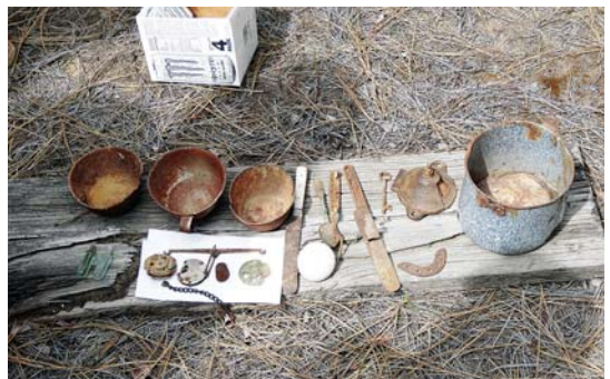
部分拾獲的華工文物。