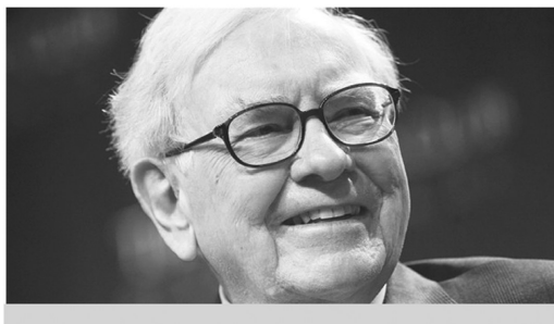
Warren Buffet told CNBC he would buy a couple hundred thousand single family homes if he could.

They will reveal these breakthrough strategies at the FREE events in the Vancouver area. When