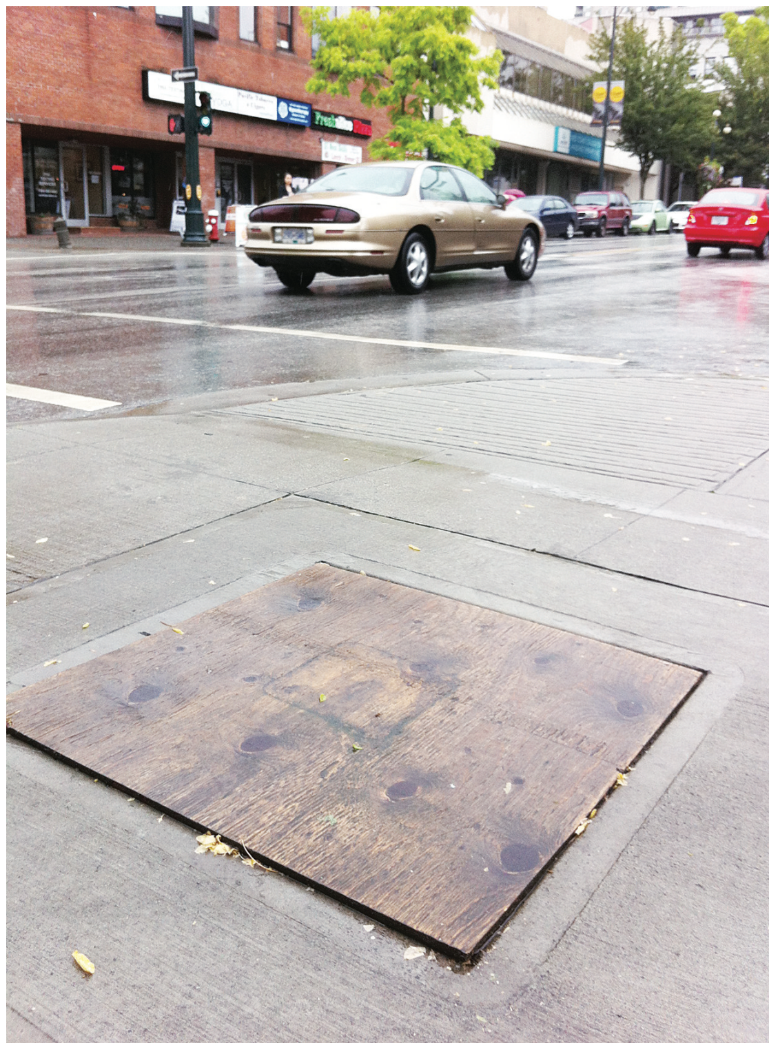
磚砌畫未裝嵌之前市府已經預留位置。