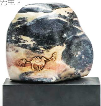
▲圖為冠軍獎品羅漢刻壽山石《任重道遠》薄意巧雕。

vip369@hotmail.ca，每人只限三聯，須具真實姓名及聯絡電話。截止收件日期為 4 月 30 日。查詢有關詳情，可致電 604-803-0369 陳先生。