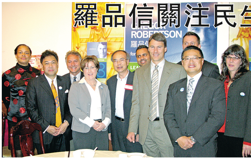
偉景溫哥華 (Vision Vancouver) 昨日於華埠舉行午餐聚會，邀請數十名華裔社區僑領及中文傳媒代表，就市選及市政議題進行交流。

【明報專訊】偉景溫哥華 (Vision Vancouver) 昨日於華埠舉行午餐聚會，邀請數十名華裔社區僑領及中文傳媒代表，就市選及市政議題進行交流。