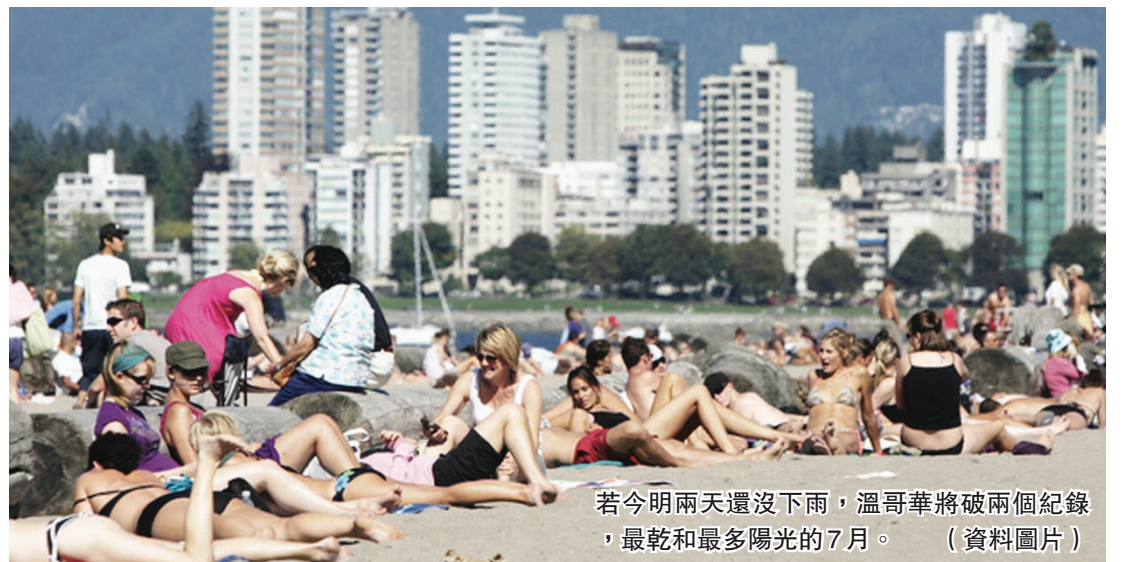
若今明兩天還沒下雨，溫哥華將破兩個紀錄，最乾和最多陽光的7月。(資料圖片)