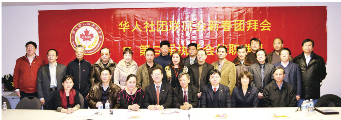
華人社團聯席會新年團拜合照。