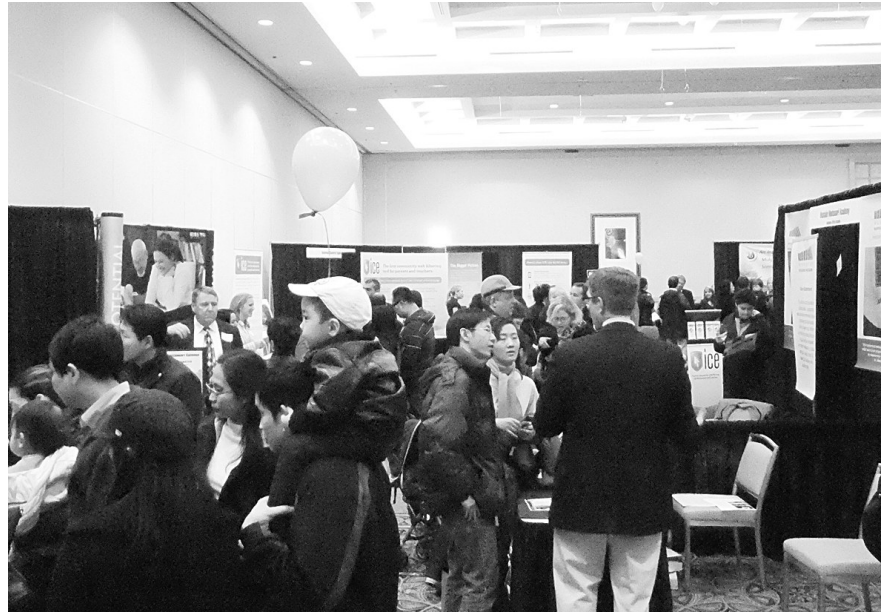
私立學校博覽會吸引過千父母前來查詢。

瑪格提到，今年參展的學校數目與去年差不多，但登記和實際到場的家長人數就大幅增長，她認為現象應與卑詩公共教育最近陷入削