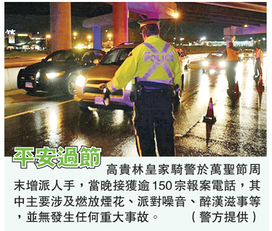
平安過節 高貴林皇家騎警於萬聖節周末增派人手，當晚接獲逾150宗報案電話，其中主要涉及燃放煙花、派對噪音、醉漢滋事等，並無發生任何重大事故。

加拿大卑詩省第七屆「漢語橋」大學生中文歌唱比賽大溫哥華賽區預賽日前在溫哥華BCIT孔子學院成功舉辦。今年來自不同大學的105名選手分別參加了大溫哥華賽區、維多利亞賽區和菲沙河賽區的預賽，經過3小時的角逐，大溫哥華賽區有17支隊伍成功晉級決賽，加上維多利亞賽區和菲沙河賽區的8首晉級歌曲，今年將有25隊參加本月7日晚(本週六)在UBC Frederic Wood劇院舉行的決賽，角逐共14個獎項，圖為預賽的精彩表演。