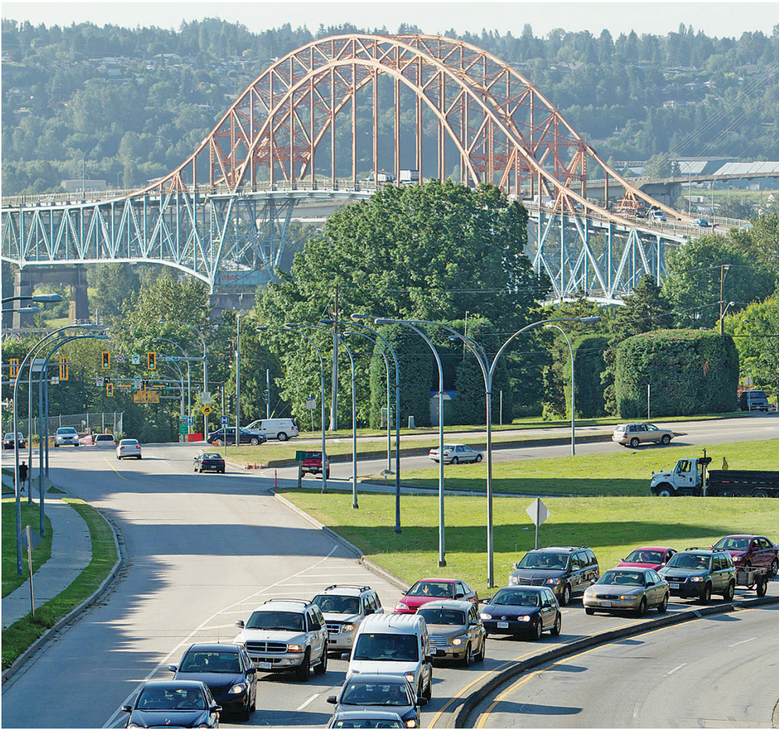
經濟師智囊團建議在大溫試行塞車收費模式來研究解決交通擠塞的成效。(資料圖片)

他亦指，只用上解決交通擠塞的加國傳統方法——擴充運輸系統容量並不能解決問題，而愈來愈多證據和政策經驗顯示塞車收費有效，在世界多個城市奏效，對當地經濟和駕駛者有利，「看