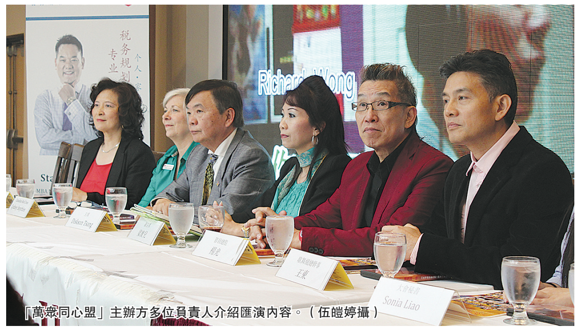
「萬眾同心盟」主辦方多位負責人介紹匯演內容。

另外，有份出席記者會的加拿大紅十字會代表表示，目前為止，該會在全國已籌集到超過8000萬元善款，其中4100萬元已經分配到災民手上，共有3.4萬戶災民受惠。她說，今次的慈善匯演再次顯示無論什麼族裔背景，對做善事都是不遺餘力，齊心合力幫助有需要的人。