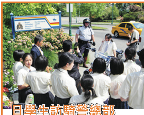
來自日本江東區的一群學生，前日下午抵達結為「姐妹市」素里市的皇家騎警總部參觀。學生們與交通警察交流，並開心地撫摸警犬，更與素里警方的「騎警熊」吉祥物公仔玩得不亦樂乎。