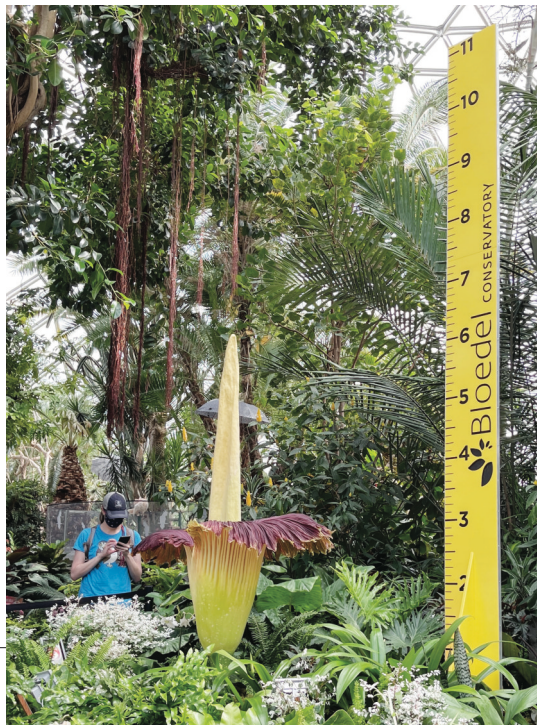
屍臭花「潰爛叔叔」近日盛開，比2018年第一次開花時長高了2英吋。

二次出風頭。它在三年前的2018年，因為首次開花和身上散發出類似「臭襪子和垃圾堆」的氣味，曾經吸引人們不惜在烈日下排隊2個半小時來「聞臭」。「潰爛叔叔」雖然生長緩慢，但比上次開花時(2018年)長高了2英吋，現在身高是73英吋。 工作人員Innessa Roosen說，屍臭花被國際自然保護聯盟(簡稱IUCN)列入瀕危物種名錄中。這種花原本只生長在印度尼西亞蘇門答臘島(Sumatra)的赤道熱帶雨林中，能夠在北美健康成活並開花，需要大量培育工作。就在上個月，溫室花園的另一株屍臭花就不幸枯萎了。 據悉，今年由於疫情原因，溫哥華溫室花園門口不設現場售票。想要慕「臭」而來的民眾，必須現在網上預約，才能按時前來「聞臭」。參觀時間限制在15分鐘。一批觀眾清場後，下一批觀眾才能進入。