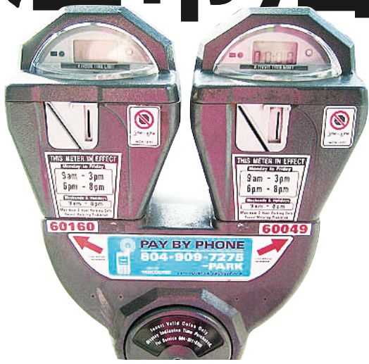
溫哥華平均泊車月費是香港的三分之一。

地產公司 Colliers International 昨日公布，每年一度的泊車費問卷調查結果，發現泊車月費中位數達224.10元，以日計算的泊車費