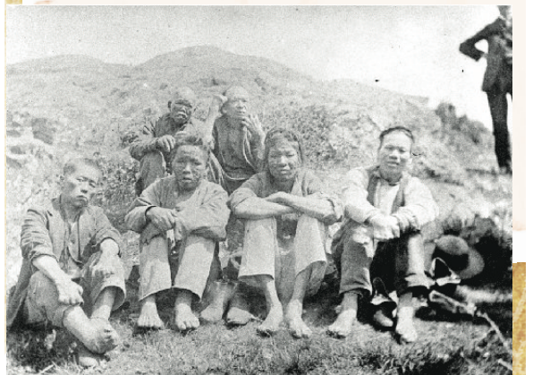
▲ 18世紀90年代被隔離在達西島的華裔癩瘋病人。

1907年1月溫哥華市議會設立於華埠旁邊的喜士定街（Hastings St.）夾緬街（Main St.），也就是現今的卡內基中心（Carnegie Centre）。當年的9月9日，溫哥華市的「排亞聯盟