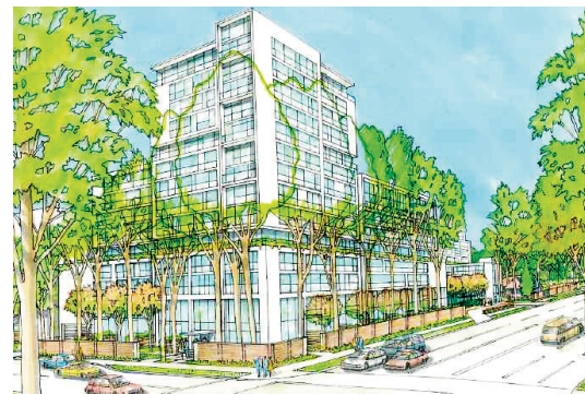
根據發展商申請，改建後57街夾格蘭護街的街景。（資料圖片）

他續稱，市府還將在明年2月與多個相關利益團體進行小組會議，以及再次舉行「開放日」，蒐集公眾意見，可能於明年7、8月時完成