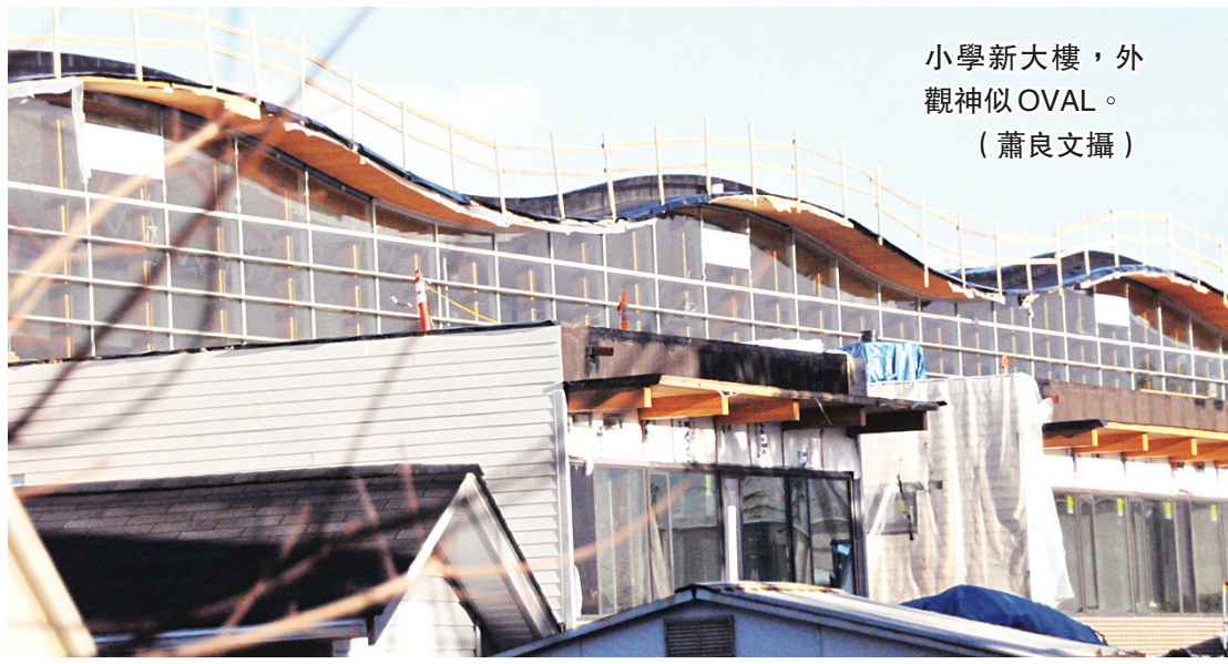
小學新大樓，外觀神似 OVAL。 (蕭良文攝)

【明報專訊】列治文 Samuel Brighthouse 小學新教學大樓工程即將完工，新大樓外觀宏偉，頗有列治文冬奧速滑館 (OVAL) 的氣派，而且教室有最新的環保科技，室內全年恆溫，二樓的落地玻璃窗更可讓學生看到北岸山景。