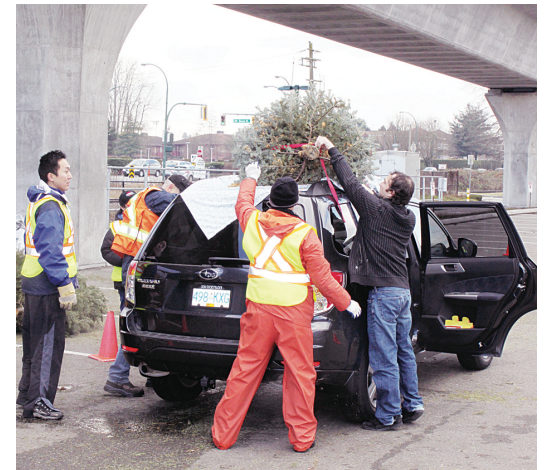
市民帶來廢棄的聖誕樹，並為活動捐款。

市民可在今日上午 10 時到下午 4 時將廢棄聖誕樹帶到以下 4 個地點回收：East Boulevard 夾 41 街 (41st Ave.) 以北的 Kerrisdale 溜冰場停車場，康禾爾路 (Cornwall Ave.) 和阿標特斯街 (Arbutus St.) 之間的 Kitsilano Beach 停車場，沙灘路 (Beach Ave.) 夾布勞頓街 (Broughton St.) 的 Sunset Beach 上層停車場，及位於東 12 街 (East 12th Ave.) 2727 號的 Rona 商場停車場