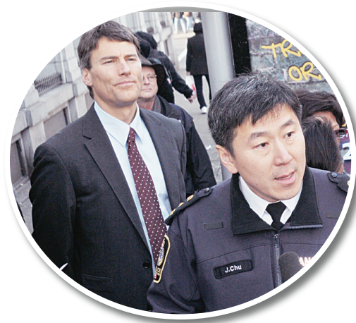
朱小孫宣布「守護姊妹計劃」，旁為溫市市長羅品信。