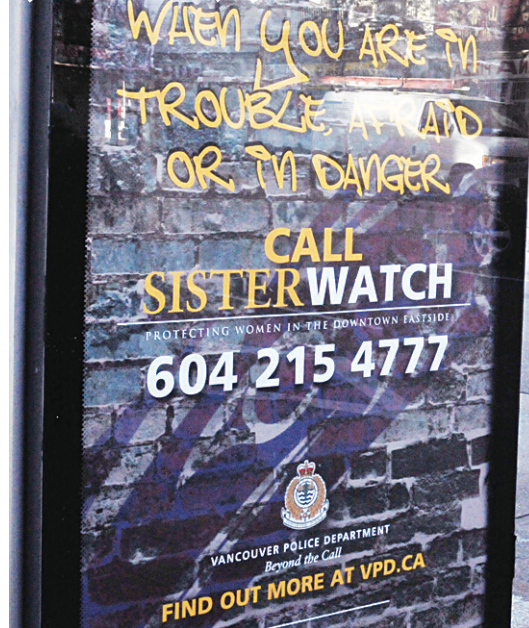
▲張貼巴士站的巨型海報，上有婦女求助專線。 ◀顯示有求助電話的流動電子板。

警方也製作求助電話資料卡，在不同地點和社區派發。這計劃會直至明年4月才結束，支出約25萬元。朱小孫強調，警方將致力打擊暴