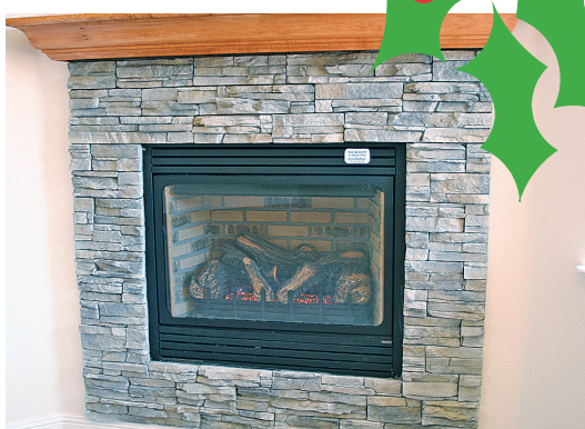
兒童醫院提醒，壁爐表面的玻璃溫度高達攝氏200度，父母應防範幼童被燙傷。

在他們體內亦會發生化學反應；確定把電視機放在安全、穩固的地方，避免幼童被其砸傷，加國每年有超過100名幼童被倒下的電視壓傷而需要到急症室求醫；當使用天然氣壁爐時，壁爐表面的玻璃溫度高達攝氏200度，父母應防範幼童被燙傷；去親友家作客時要避免幼童被新奇的物品吸引，不慎吞下有毒物體、或是發生窒息等意外；含有酒精的飲品、硬糖果及堅果等要放置在幼童不可碰觸到的地方；避免幼童接近有毒植物如冬青樹等，如果他們碰觸或吞食植物，會引起中毒、咳嗽；確保室內禁