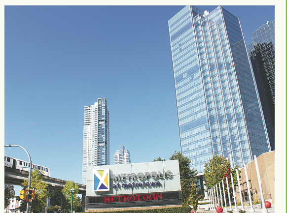
鐵道鎮商場位於南本那比選區，近來大量華裔人口移居該區。

前屆大選在本那比-道格拉斯選出的國會議員甘迺迪，此次選擇在南本那比參選，而不是在北本那比-西摩（Burnaby North-Seymour）參選，有認為應與南本那比傳統上有較多聯邦新民主黨的支持勢力有關。