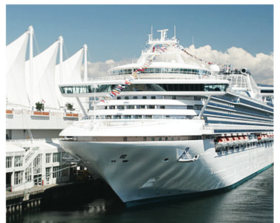
溫市加拿大廣場郵輪碼頭明日將十分繁忙。

溫哥華港口局數據顯示，每艘郵輪抵達溫市停靠，可為本地經濟帶來約200萬的收益。預計