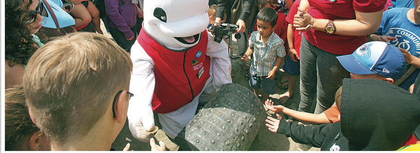
▲潛水蛙人將「找到」的藏寶圖交給「白鯨」。