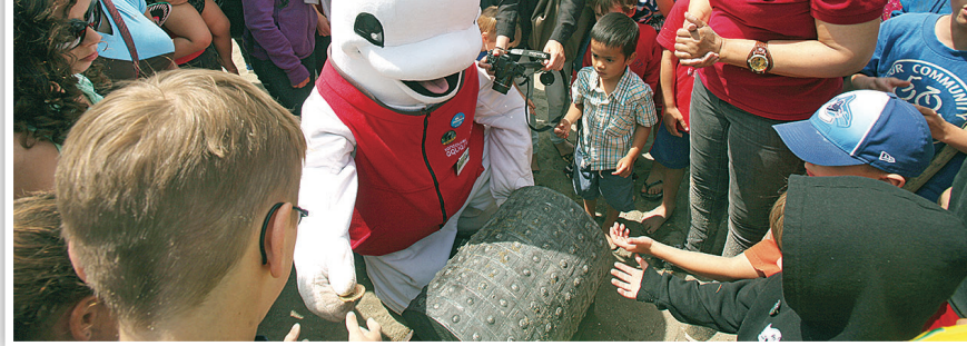
▲潛水蛙人將「找到」的藏寶圖交給「白鯨」。