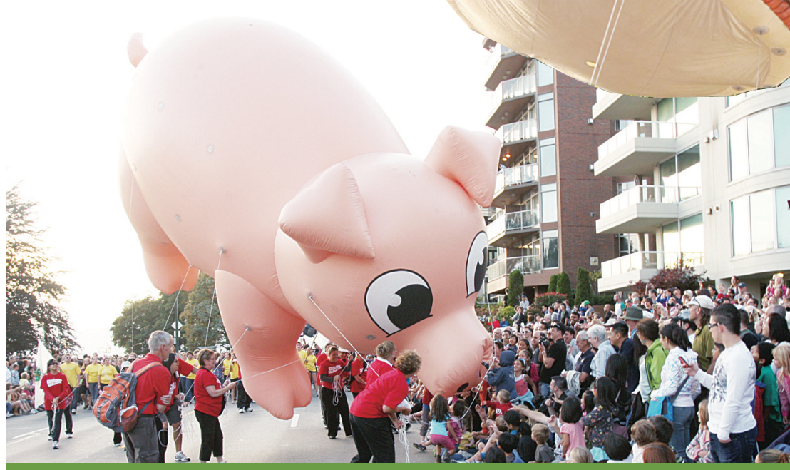
▲兩層樓高的豬小姐頗與路人親吻。 ▼PNE小姐的名字仍有不少人記得。