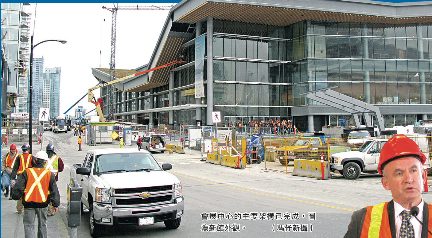
會展中心的主要架構已完成，圖為新館外觀。