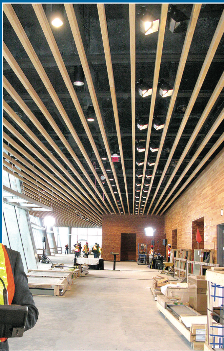
▲新館內部裝修很有藝術感。 ◀貝爾德形容整個溫哥華會展中心新館是「卑詩省出品」。

【明報專訊】溫哥華會展中心擴建工程昨日進入倒數100日，承建公司特地開放讓傳媒參觀。在省府追加預算後，承建公司強調不會出現超支，並承諾會準時完成這座「卑詩出品」的新展覽館。