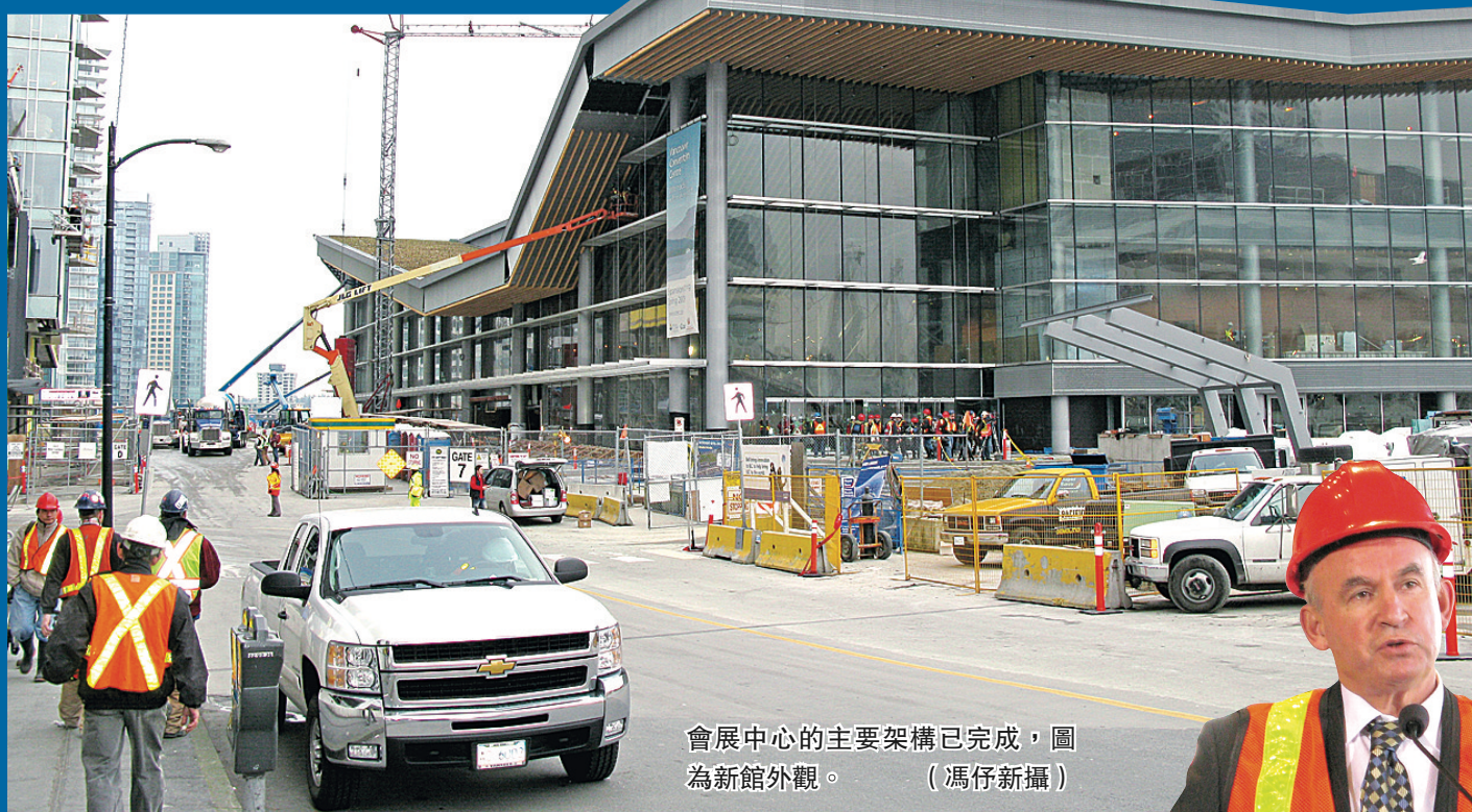
會展中心的主要架構已完成，圖為新館外觀。