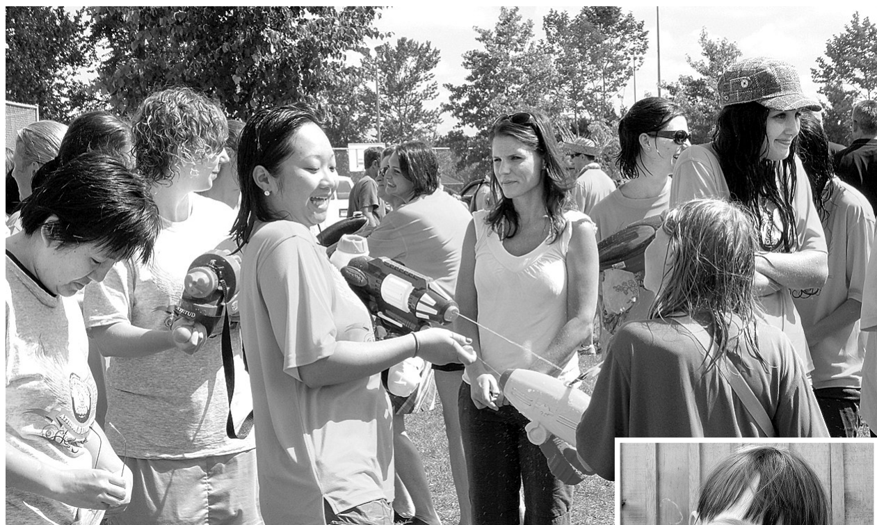
▲出發前，夏令營成員都獲贈一枝水槍，不少人當場就派上用場，在炎炎夏日，享受清涼感覺。