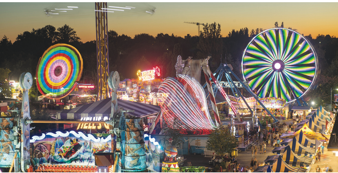
PNE昨日公布，機動遊樂場Playland定於6月11日（下周五）晚上重開。

【明報專訊】太平洋國家展覽（PNE）昨公布，機動遊樂場Playland定於6月11日（下周五）晚上重開，但只接受低陸平原及菲沙河谷的區內民眾入場。主辦機構指已獲得區域衛生局批准。