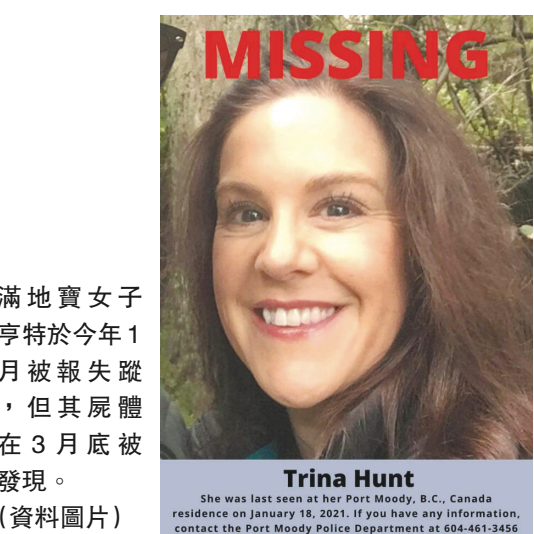
滿地寶女子亨特於今年1月被報失蹤，但其屍體在3月底被發現。（資料圖片）

【明報專訊】滿地寶（Port Moody）女子失蹤逾兩個月後，其屍體於3月底在遠離她住所逾一小時車程的地方被發現，迄今仍未破案，死者家屬現懸紅5萬元求線索。 據整合兇案調查組（IHIT）指，死者亨特