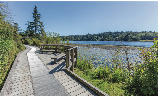
今年4月，一名70多歲白人男子被指在本那比鹿湖湖畔步行徑上，用行山杖襲擊一名亞裔女子。

，持行山杖男子原本已走開，但對方走回頭和喝令K.C.不要跟着他。當男子第二次走回頭時，一度離K.C.很近，與其臉部距離不足2呎，當時他將行山杖放在肩上和準備好攻擊的姿勢。「你剛剛叫我什麼？」對方沒有再出言不遜，但不斷重複指K.C.是說謊的人，指他和那女子向警方報案。 K.C.又指，他部分亞裔長者都居住在害怕再獨自走到該公園，因為「這男子是居住在我們的鄰舍內」。 本那比騎警近日表示，市內亞裔仇恨犯罪已飆升了350%。