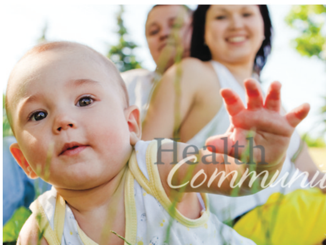
▲「我的健康我的社區」宣傳圖片。