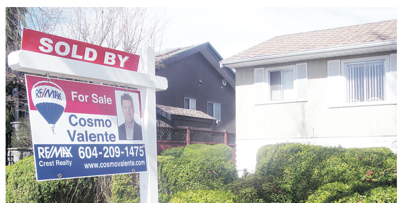
本省上月住宅銷量達7,650間，按年增長18%，銷情是2007年以來最佳的7月份。(資料圖片)

穆爾表示，目前處於平衡市場階段，他預計，房價將呈溫和上揚趨勢，但不太可能出現大的變動，而是依通脹率有所提高。