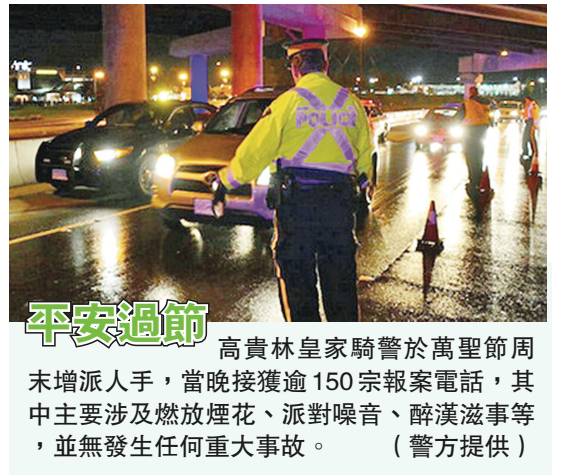
平安過節 高貴林皇家騎警於萬聖節周末增派人手，當晚接獲逾150宗報案電話，其中主要涉及燃放煙花、派對噪音、醉漢滋事等，並無發生任何重大事故。

加拿大卑詩省第七屆「漢語橋」大學生中文歌唱比賽大溫哥華賽區預賽日前在溫哥華BCIT孔子學院成功舉辦。今年來自不同大學的105名選手分別參加了大溫哥華賽區、維多利亞賽區和菲沙河賽區的預賽，經過3小時的角逐，大溫哥華賽區有17支隊伍成功晉級決賽，加上維多利亞賽區和菲沙河賽區的8首晉級歌曲，今年將有25隊參加本月7日晚(本週六)在UBC Frederic Wood劇院舉行的決賽，角逐共14個獎項，圖為預賽的精彩表演。