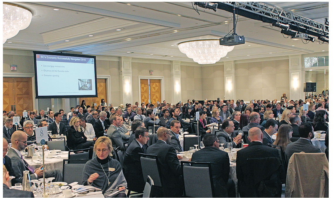
CMHC年度樓市展望會議吸引約300名業界人士出席。

樓市持續暢旺亦令業主擔心是否存在泡沫爆破風險。艾達瑪琪引述CMHC 2015年第三季的樓市評估報告，指在市場過熱、樓價過高、過度興