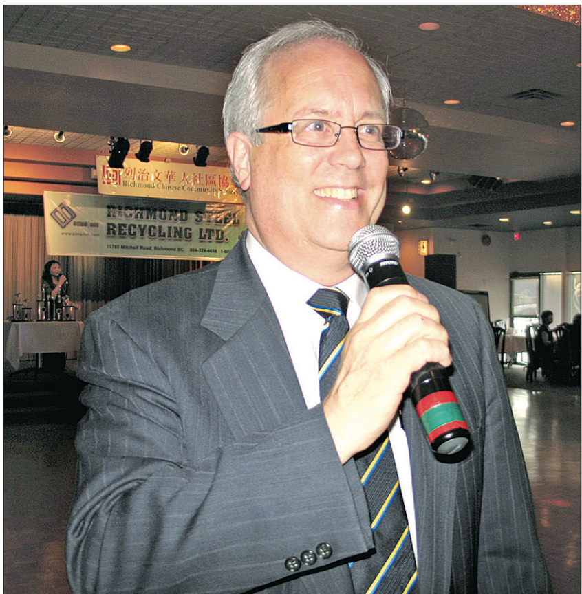
馬保定獻唱一曲「Take Me Home Country Roads」獲得全場掌聲。

【明報專訊】有鑒於四川災情嚴重，列治文華人社區協會昨日趁着一年一度的卡拉OK籌款晚宴，將部分收益撥作賑災之用。為了響應賑災活動，席上嘉賓之一的列治文市長馬保定(Malcolm Brodie)也即場獻唱一曲「Take Me Home Country Roads」，這是馬保定首次為該協會獻唱。