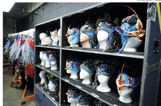
各種精美頭飾及服裝。

《魅影——首次翱翔》去年12月在滿地可首演，講述發生在3000多年前的《阿凡達》，三個無