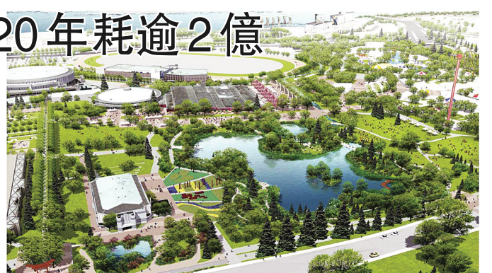
公園擴建後的新貌構想圖。

【明報專訊】溫哥華市議會昨日通過，喜士定公園(Hastings Park)/太平洋國家展覽館(PNE)未來20年擴建總綱(Master Plan)；這項將耗資逾2億元的規劃大計，會倍增綠化土地，但會同時建或被指可賺錢的展覽場地。