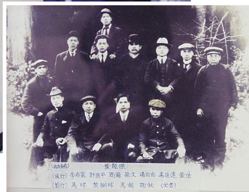
孫中山與溫哥華洪門人士合影。

辛亥革命在1911年10月10日爆發，滿清政府被推翻，明年將屆100周年，兩岸政府均準備盛大紀念活動，本地僑界也計劃籌辦不同活動。據悉，部分準備紀念的僑團原有意接觸不同黨派的機構，攜手共同慶祝中華民族這一盛事，但經過初步探討，雙方就慶祝活動的名稱究竟是「革命」還是「建國」可能出現分歧，原先的良好意願不一定能夠實現。 加拿大中國洪門民治黨常務副總主委鄭炯光昨日表示，雖然該會也希望見到跨黨派合作，但目前看來仍然有一定難度。 另一方面，鄭炯光表示，當年加拿大洪門以及華人，特別是溫哥華洪門以及華人對辛亥革命的貢獻應得充分的確認。鄭炯光說，當年華人口中，洪門成員佔有一個頗大的比重。而當年洪門以及加拿大華人，特別是溫哥華華人對辛亥革命貢獻良多，但革命成功後，一直未