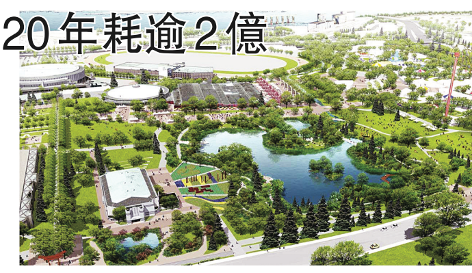
公園擴建後的新貌構想圖。

【明報專訊】溫哥華市議會昨日通過，喜士定公園(Hastings Park)/太平洋國家展覽館(PNE)未來20年擴建總綱(Master Plan)；這項將耗資逾2億元的規劃大計，會倍增綠化土地，但會同時建有被指可賺錢的展覽場地。 市府指經過6年的計劃及諮詢，最終批准這總綱，市長羅品信(Gregor Robertson)表示，喜士定公園/太平洋國家展覽館總綱會提供更多綠化地和戶外活動。計劃預計開支達2.086億，當中8460萬元是為興建各建築物，包括新展覽場地和歷史建築物更新等。 溫市府在2004年從省府接手PNE的管理及擁有權，然後進行公眾諮詢，並於去年草擬規劃總綱，市府並將綠化地面積由48英畝增至最多