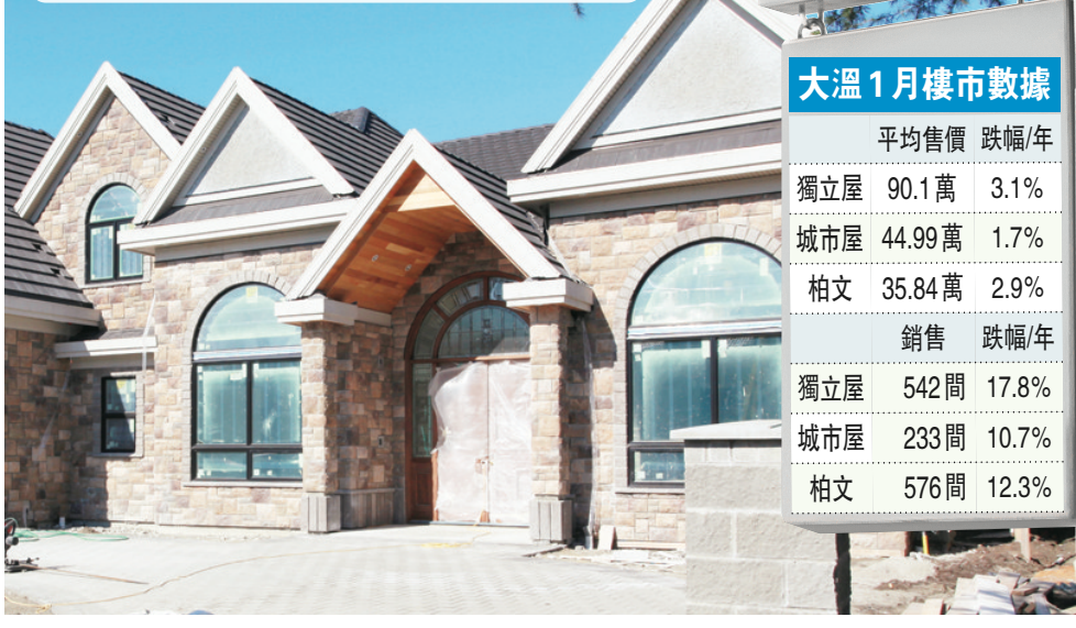
大溫上月獨立屋銷量跌了 17.8%。(資料圖片)

柏文同樣價量齊跌，1 月僅有 576 間易手，按年下跌 12.3%，平均價格則下跌 2.9% 至 358,400 元。城市屋平均價按年跌 1.7% 至 449,900 元，較去年 4 月的高位跌 7.7%。銷量則跌 10.7% 至 233 間。