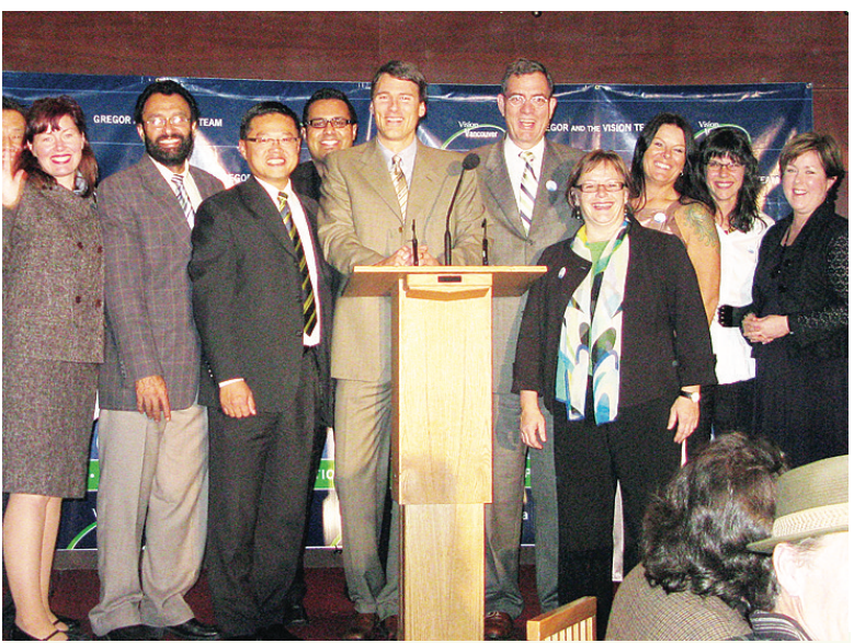
偉景籌款晚宴 偉景溫哥華昨晚舉行籌款晚宴，約有800人出席，一同支持由市長候選人羅品信(Gregor Robertson)帶領的16人參選團隊。羅品信致辭時一再強調，即將於下周公布的競選政綱，不會像對手般漠視溫市街頭的露宿者，偉景溫哥華的政綱焦點是在2015年之前，全面解決市內的無家可歸者問題。