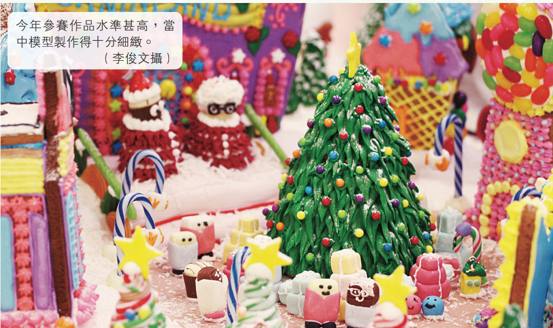
今年參賽作品水準甚高，當中模型製作得十分細緻。

【明報專訊】溫市中心 Hyatt Regency 酒店一年一度建造巨型薑餅屋迎接聖誕的活動由昨日開始，直至今月27日，預料可吸引二萬人次到場參觀。