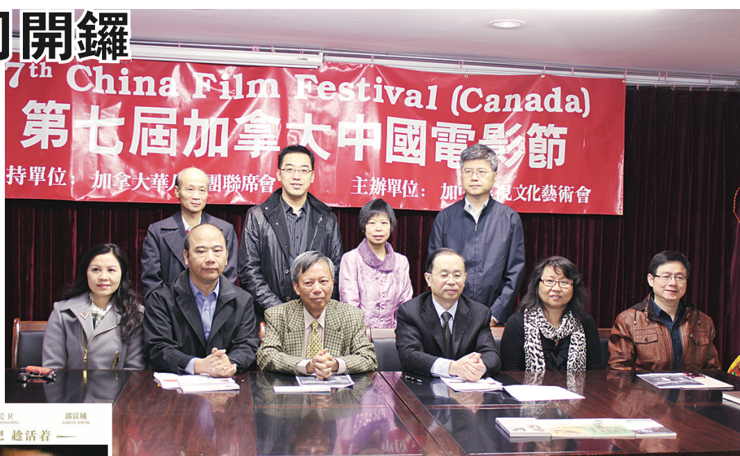
▲第七屆加拿大中國電影節籌備委員會成員歡迎市民購票支持。 ▲電影節將放映章子怡和郭富城主演的《最愛》，圖為該片海報。

由顧長衛導演、章子怡、郭富城主演的《最愛》將安排在12月9日下午2時放映；緊接着，4時將放映由黃真真導演、周冬雨、李治廷