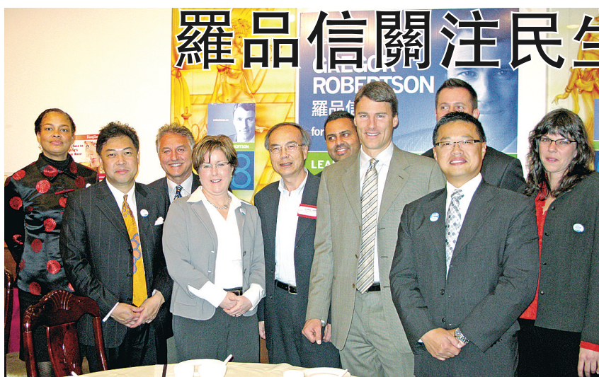
偉景溫哥華 (Vision Vancouver) 昨日於華埠舉行午餐聚會，邀請數十名華裔社區僑領及中文傳媒代表，就市選及市政議題進行交流。

【明報專訊】偉景溫哥華 (Vision Vancouver) 昨日於華埠舉行午餐聚會，邀請數十名華裔社區僑領及中文傳媒代表，就市選及市政議題進行交流。