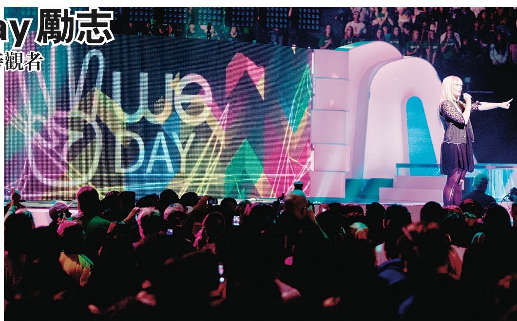
X Factor 的評審 Demi Lovato 應邀在 We Day 表演。溫哥華 We Day 活動總共有約2萬名青少年參加。