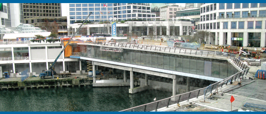
舊館將有一條無敵海景步行道通往新館。

而場館所用的玻璃，則來自錦碌市（Kamloops）一間公司，整個場館都是「卑詩省出品」。