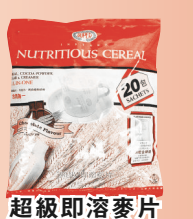
超級即溶麥片 (朱古力味)

加拿大總代理 Canada Sole Agent WYGEN Foods (Canada) Inc. 偉成食品有限公司