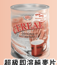
超級即溶純麥片 (罐裝)