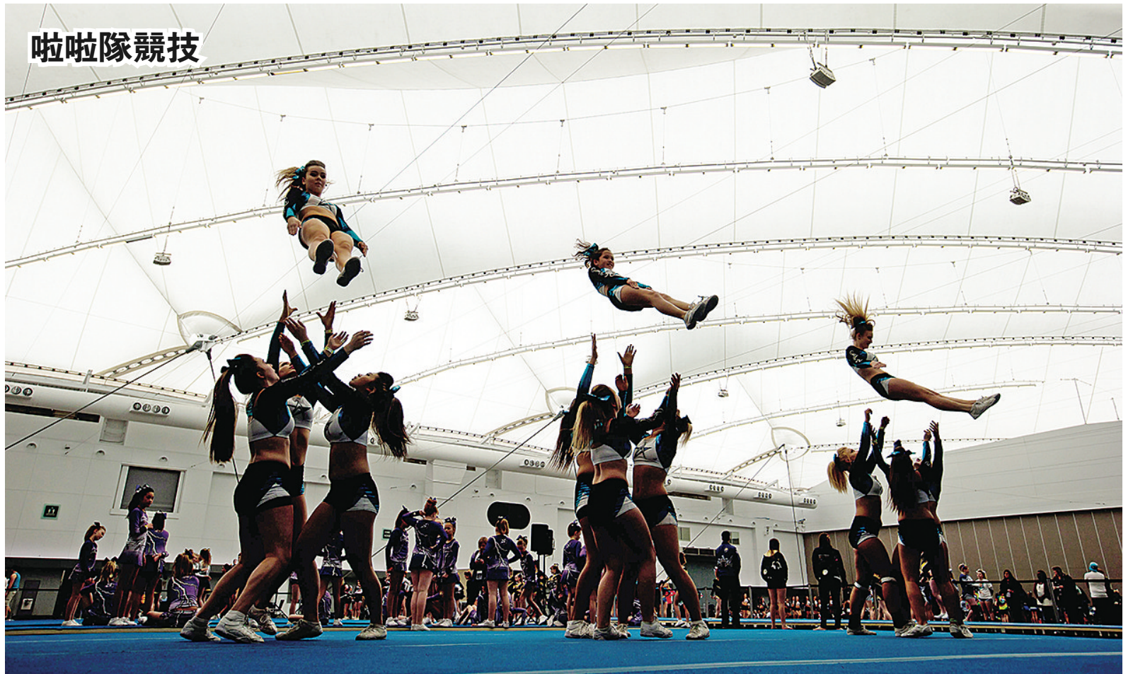
為期3天的海天國際啦啦隊冠軍賽周日在溫哥華閉幕，主辦方指，來自北美的150隊、逾2500名選手參加比賽。圖為Adrenaline All Stars的成員在熱身時的拋空動作。

欲了解更多登記捐獻器官信息，請瀏覽 http://www.transplant.bc.ca/index.asp 。