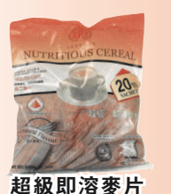
超級即溶麥片 (原味)