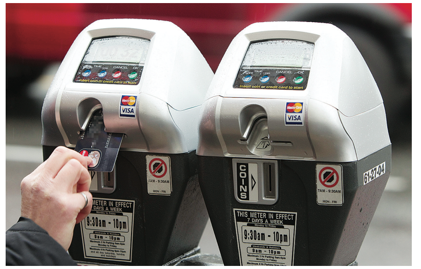
調查顯示，溫市中心停車費月均為302元，但在全加只排到第五。(資料圖片)

他表示，泊車費最終是取決於市場需求。他比較想知道，車主是否會無限制接受泊車費的上漲，還是上漲到一定水平之後，車主會說「夠了」，不願意再接受高價泊車