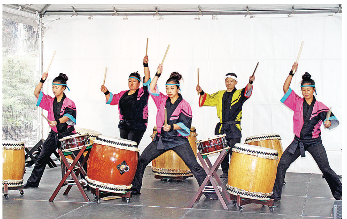
伴隨着日本傳統太鼓表演，櫻花節開幕慶祝活動正式開來序幕。

每年櫻花「花謝花飛飛滿天」的不同姿態是一件十分享受的事情。他表示，今年櫻花開放狀態爲近5年之最，在細雨下，花瓣或蕊上水珠晶瑩，異常美麗，有利於自己的創作。