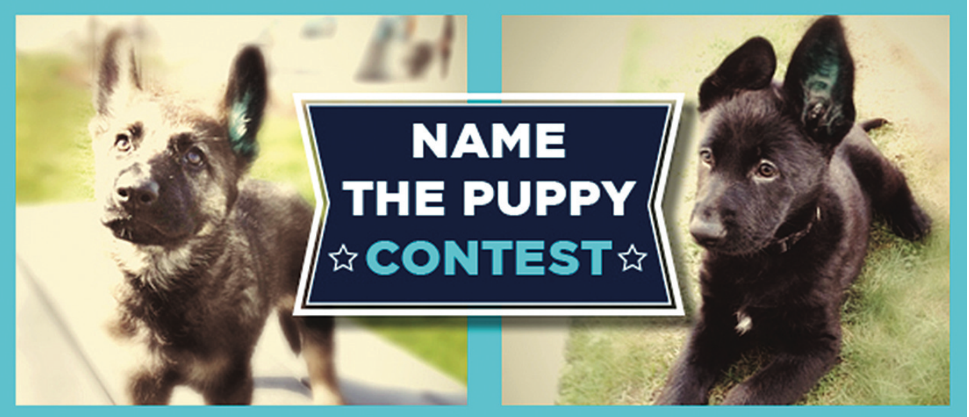
圖為溫市警局有待命名的警犬。

費。他表示，已看到有些大公司由於受不了泊車費過高或租金高，而準備將辦公地點轉移到郊區。