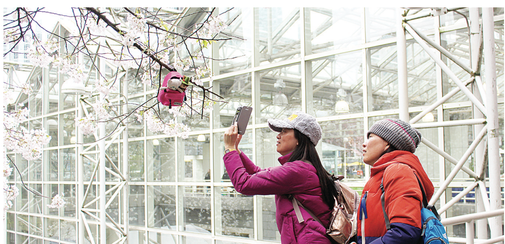
遊客們將隨身小物品掛在櫻花樹上拍攝更爲有趣的照片。