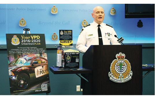
帕爾默希望市民多提意見。