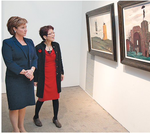
根據簽署內容，保利文化將會在北美洲擴展業務，並至少作三線發展，包括表演與舞台管

省府早前成立「溫哥華企業總部」（HQ Vancouver）計劃，目標在2020年前吸引5間國際企業到本省開設總公司，並於2017年前先吸納其中兩間，預計投資金額多達1億元，可創造500份職位。