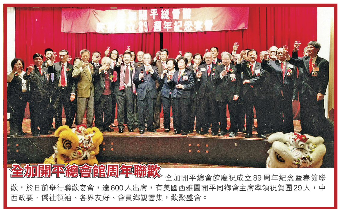
全加開平總會館周年聯歡 全加開平總會館慶祝成立 89 周年紀念暨春節聯歡，於日前舉行聯歡宴會，達 600 人出席，有美國西雅圖開平同鄉會主席率領祝賀團 29 人，中西政要、僑社領袖、各界友好、會員鄉親雲集，歡聚盛會。