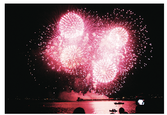
煙花匯演實破 40 萬人出席紀錄。(資料圖片)