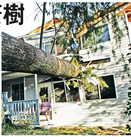
若溫市保護樹木的修例獲通過，只有構成危險或枯萎的有問題樹木才可砍掉。(資料圖片)

建議的修例只准許砍掉有問題，如有病、將枯萎和構成危險的樹木，有關建議最快下周投票決議。