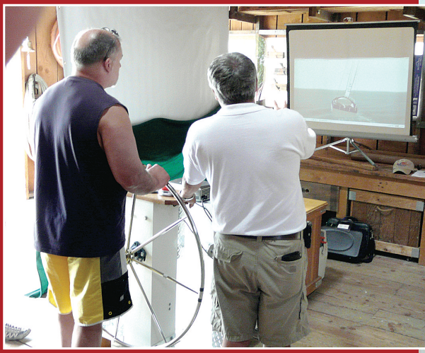
航海節有模擬駕駛訓練。