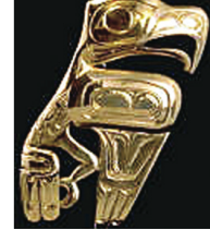
▲完整無缺的黃金老鷹。 ▲被偷走的泥岩雕刻檔案圖片，右方紅圈處目前仍下落不明。