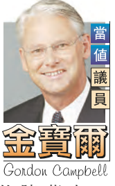
當值議員 金寶爾 Gordon Campbell

【明報專訊】上星期省府發表了省情咨文，藉此機會向省民陳述我們對未來的展望，以及向公眾解釋我們正在進行的計劃及其原因。 本省將要面對的挑戰極為艱巨，但卑詩省以前也經歷過困難的日子，而省民憑著毅力和創意去面對每次困境，所以在渡過難關後我們都變得更加堅強和更有自信。 我們正致力將省民的利益放在特殊利益之前。政府希望你口袋裏用在醫療及教育上的每一分錢，都能夠令病人和學生受惠。但這在過去十年都未有出現過，情況也因之而趨惡化。 在八個月前，你們投票支持作出改變，這是很容易理解的。卑詩省民清楚表明他們不想見到以往的情況持續下去。當然我們都希望作出改革時可以較為容易接受，少一些痛苦又或者在過程中出現較少爭議，但我認為，大多數人內心都清楚知道在改變的過程中我們會遇上挑戰，而這是