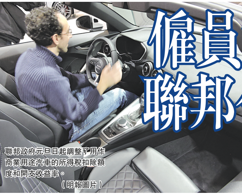
聯邦政府元旦日起調整了用作商業用途汽車的所得稅扣除額度和開支收益率。

【明報專訊】聯邦政府在新一年調整了商用汽車的所得稅扣除額度 (Income Tax Deduction Limits) 和開支收益率 (Expense Benefit Rates)。用以決定僱主為僱員繳交的個人汽車開支應課稅福利 (Taxable Benefits)，整體訂明利率將微減1仙至每公里2.5毫。