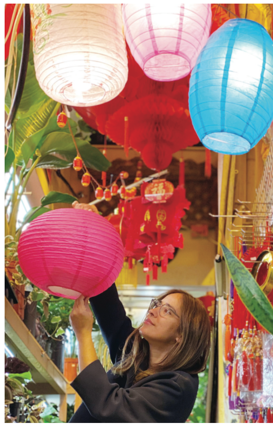
華埠迎接中秋節，舉行「點亮華埠！」活動，掛燈籠展現華裔傳統文化。

【明報專訊】華埠下月將張燈結彩迎接中秋節，為期兩日的「點亮華埠！」(Light Up Chinatown!)活動，將於9月11日至12日舉行，將會展示精美的燈籠，吸引民眾到場了解華埠充滿活力的文化歷史。