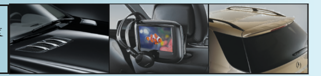
鍍鉻車頭蓋通風裝飾 後座多媒體娛樂系統 車尾擾流器

平治汽車「家家有平治」優惠計劃為閣下提供駕駛2011年款B系AVANTGARDE EDITION, C, ML系AVANTGARDE EDITION和GLK系最好時機，除首三月免供款/月租外，選購及安裝各項原裝平治後加配備更有25%折扣，B系及ML系各款前衛型號更為閣下提供分別超過$900及$3000免費配置，一個前所未有的優惠計劃，為免向隅，請即到大溫各平治陳列室試車選購。